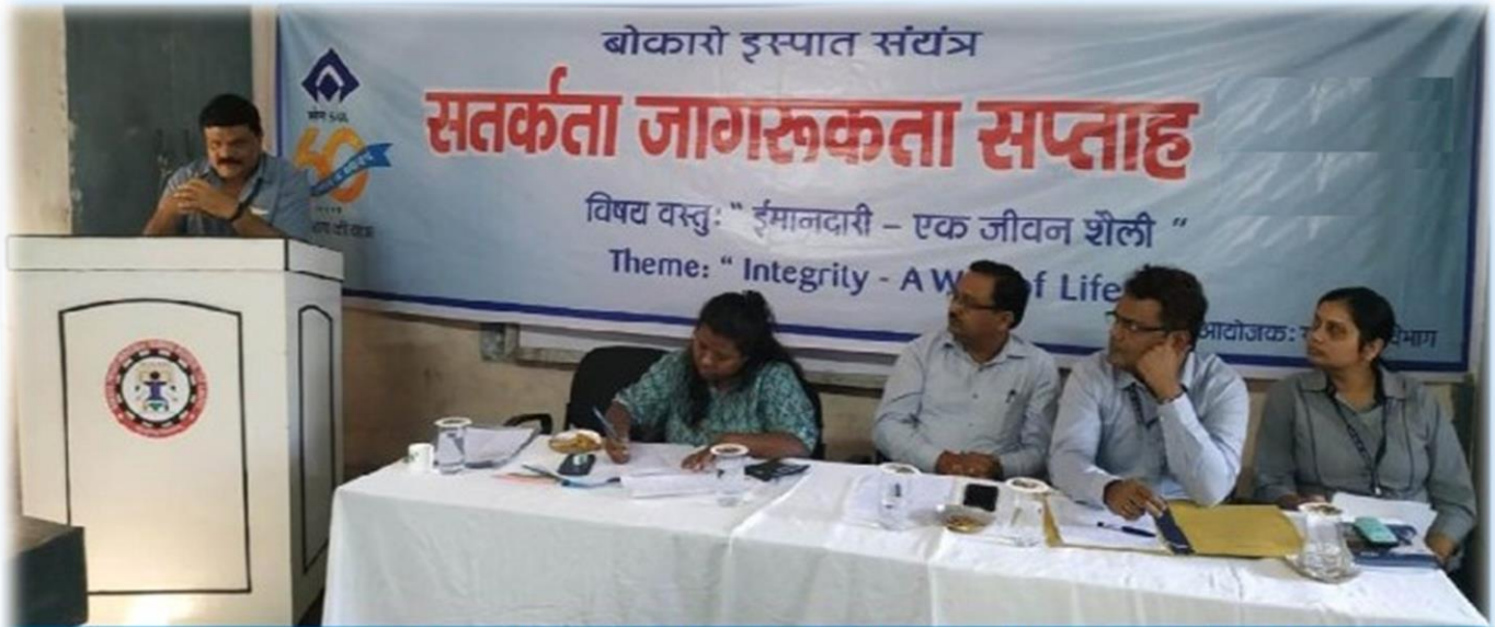
जागरूकता सप्ताह पर आईटीआई के प्रशिक्षुओं को संबोधित करते अधिकारीगण