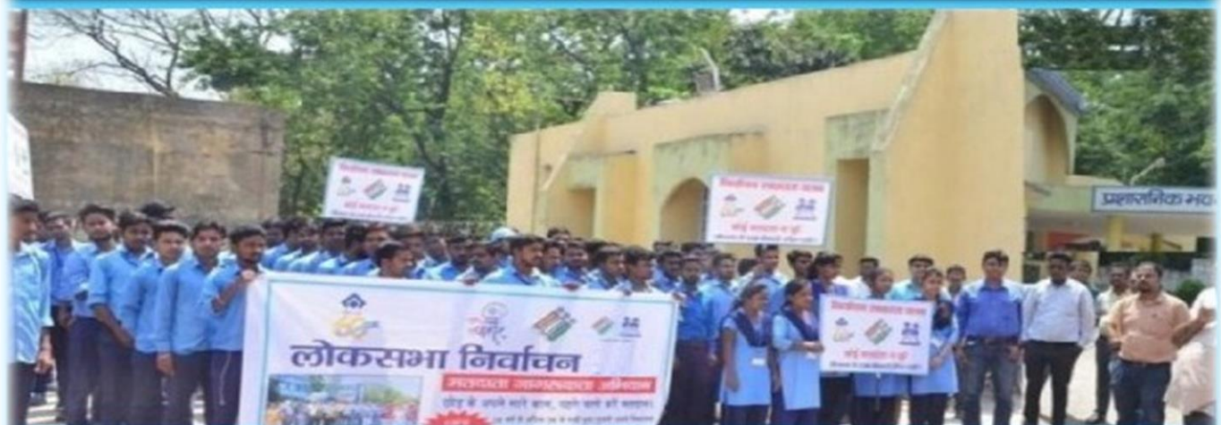
लोगों में चुनाव के प्रति जागरूकता फैलाने का एक प्रयास