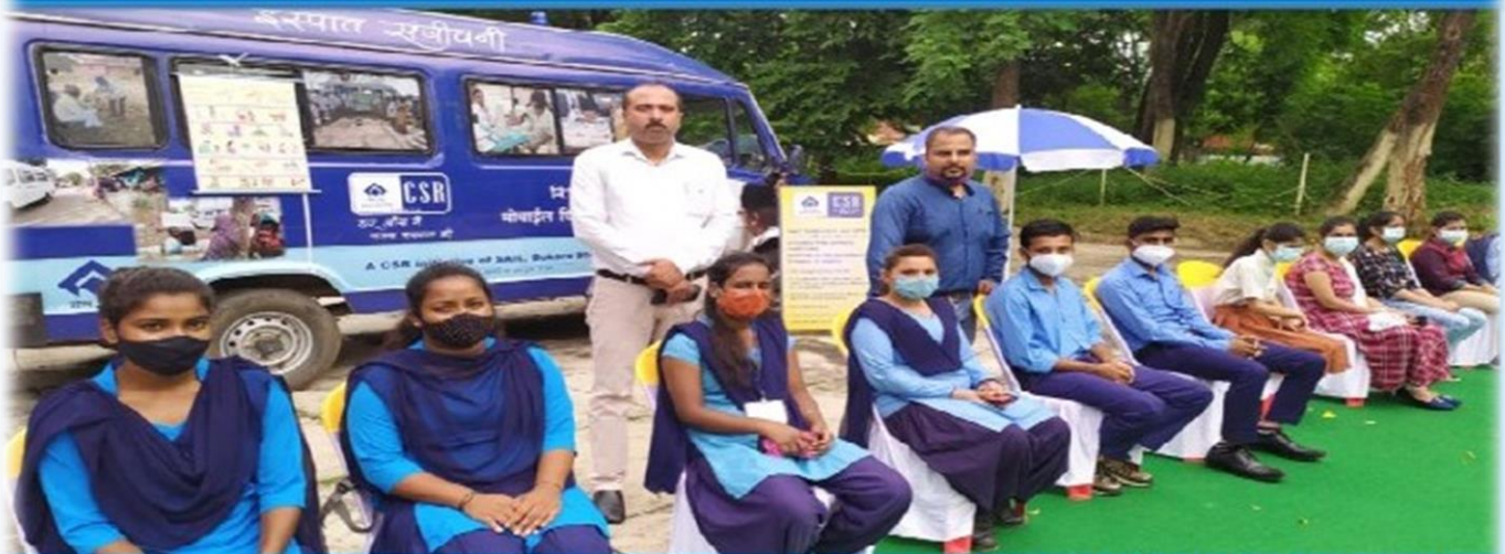
सी.एस.आर. द्वारा आयोजित कार्यक्रम में हिस्सा लेते आईटीआई के प्रशिक्षु