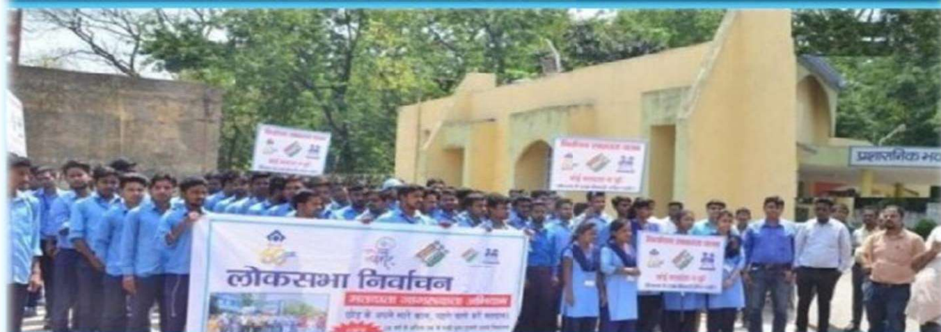
लोगों में चुनाव के प्रति जागरूकता फैलाने का एक प्रयास