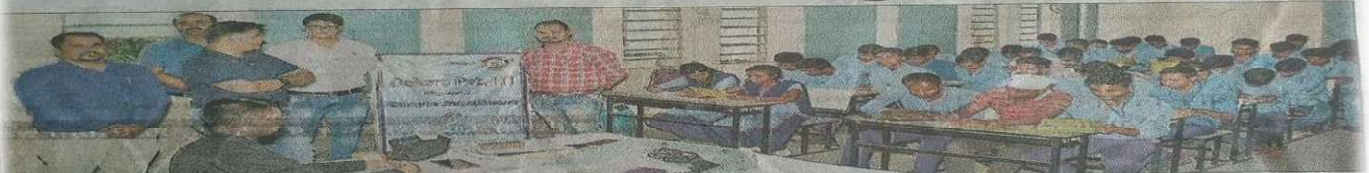
कैम्पस में उपस्थित टाटा मोटर्स के पदाधिकारी.

बोकारो. बीएसएल सीएसआर संचालित बोकारो प्राइवेट आइटीआई सीआईएसएफ कैम्पस में शनिवार को कैम्पस सेलेक्शन हुआ. टाटा मोटर्स संस्थान के पदाधिकारियों ने कैम्पस सेलेक्शन में प्रशिक्षुओं का सेलेक्शन किया. इसमें 110 प्रशिक्षुओं ने हिस्सा लिया. लिखित परीक्षा के बाद 101 प्रशिक्षु सफल घोषित किये गये. सफल प्रशिक्षुओं को कंपनी की ओर से नियुक्ति पत्र प्रदान किया जायेगा.