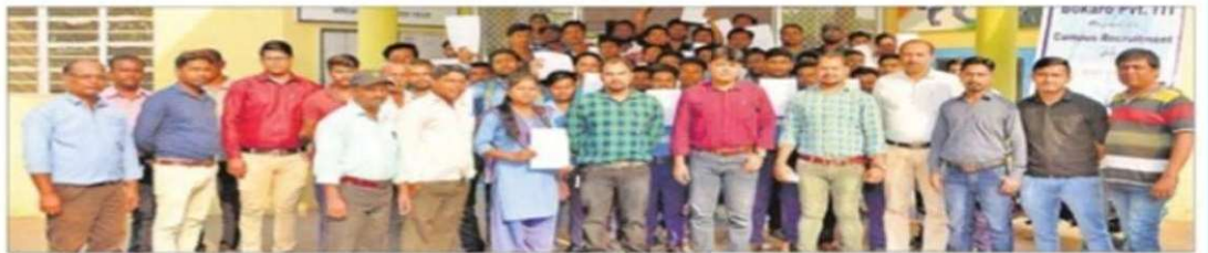
प्लेसमेंट पर के सफल प्रशिक्षु व अन्य.

● 67 प्रशिक्षुओं का चयन टाटा मोटर्स, उत्तराखंड में हुआ वरीय संवाददाता > बोकारो बीएसएल के सीएसआर से बोकारो इस्पात शिक्षा न्याय ड्राव संचालित बोकारो प्राइवेट आइटीआई का कैम्पस प्लेसमेंट ड्राइव गुरुवार को हुआ, विभिन्न ट्रेड के 67 प्रशिक्षुओं का चयन टाटा मोटर्स, फत नगर- उत्तराखंड में हुआ, प्रशिक्षु आइटीआई ट्रेनी के रूप में इस