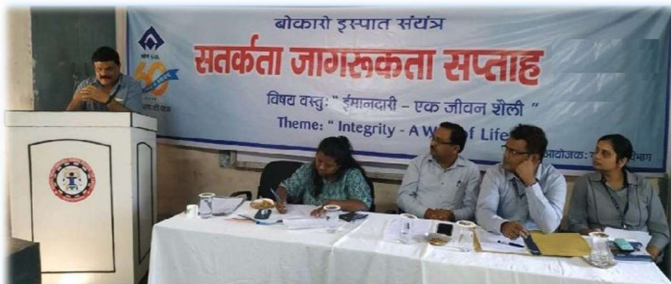
जागरूकता सप्ताह पर आईटीआई के प्रशिक्षुओं को संबोधित करते अधिकारीगण