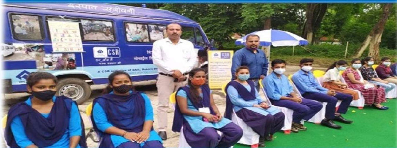
सी.एस.आर. द्वारा आयोजित कार्यक्रम में हिस्सा लेते आईटीआई के प्रशिक्षु